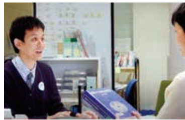
調べもの案内の様子