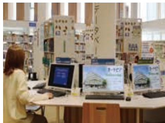
20種類を超えるデータベースが使える専用端末