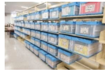
市内小中学校等に貸し出す団体貸出セット