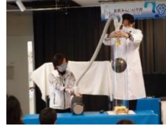
サイエンスショー

(※) 2018, 2019, 2020年度観覧者数ランキング(小規模館) 3年連続で断トツの第1位