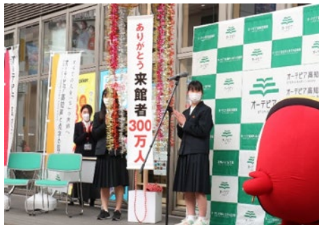
令和3年12月7日 来館者300万人達成！