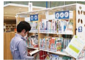
転職・転業、資格取得に役立つ「職業ガイドコーナー」(3階)